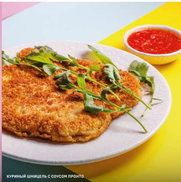
КУРИНЫЙ ШНИЦЕЛЬ С СОУСОМ ПРОНТО