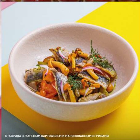
СТАВРИДА С ЖАРЕННЫМ КАРТОФЕЛЕМ И МАРИНОВАННЫМИ ГРИБАМИ