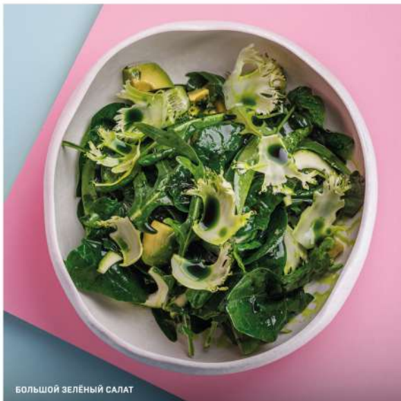
БОЛЬШОЙ ЗЕЛЁНЫЙ САЛАТ