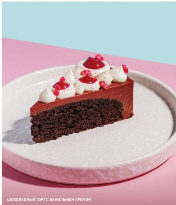
ШОКОЛАДНЫЙ ТОРТ С ВАНИЛЬНЫМ КРЕМОМ