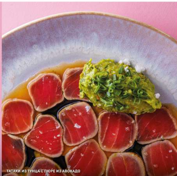
ТАТАКИ ИЗ ТУНЦА С ПЮРЕ ИЗ АВОКАДО