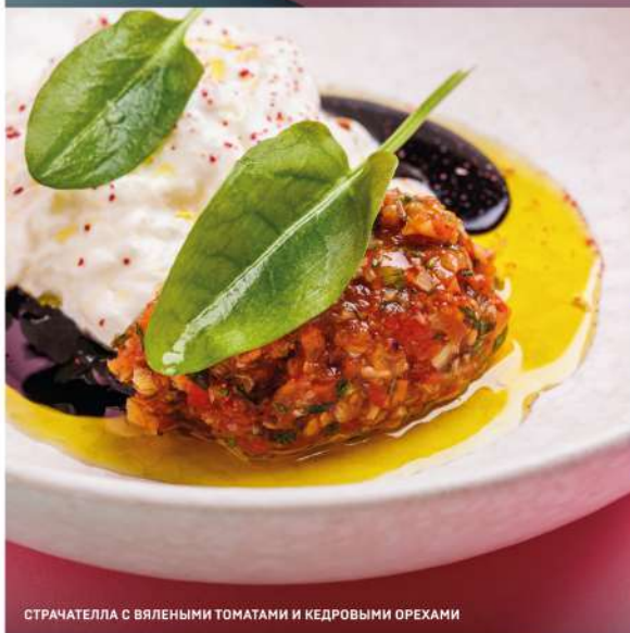
СТРАЧАТЕЛЛА С ВЯЛЕННЫМИ ТОМАТАМИ И КЕДРОВЫМИ ОРЕХАМИ