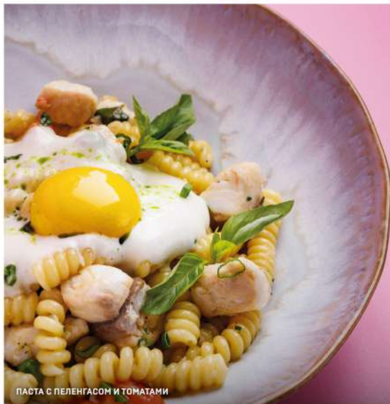
ПАСТА С ПЕЛЕНГАСОМ И ТОМАТАМИ